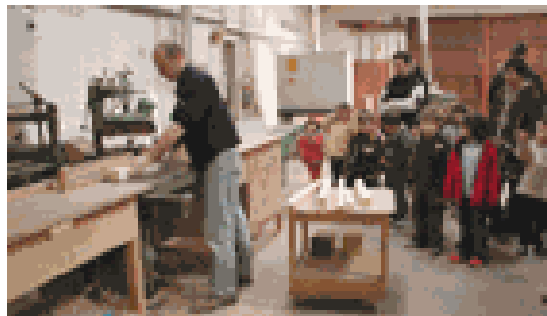
Sortie à la menuiserie : De l'importance de la gestion des espaces, de l'encadrement et du placement des groupes pendant la démonstration du professionnel...

Bien souvent, les jeunes enfants ne connaissent pas le comportement attendu sur les lieux publics (musées, expositions...)