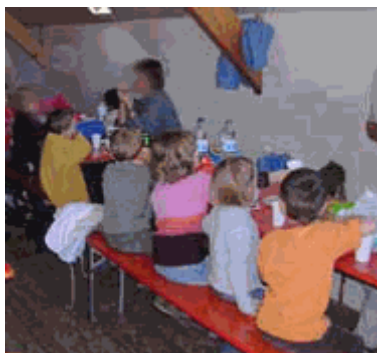
Une sortie à l'automne : Le repas du midi au chaud et au sec...