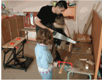
De retour en classe, Réinvestissements en Arts Plastiques et « Découvrir le monde »