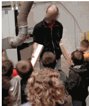
Sortie à la menuiserie :

Les explications données par un professionnel, même si elles ne sont pas directement transposables pour vos jeunes élèves, vous permettent de structurer les apports pédagogiques de votre sortie (en mettant l'accent sur un aspect de son travail, en limitant ou orientant ses explications sur certains points intéressants, en découvrant des aspects techniques que vous pourrez expliquer et réinvestir avec vos élèves, etc.